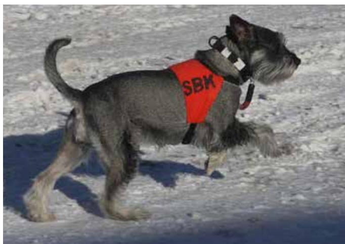
Tula jobbar med sök

Nu är utställnings- och tävlingssäsongen i full gång. Självt har jag varit i Vejen Danmark för en tredagarsutställning med Vicke och Mazze. Det blev inga topplaceringar, men kunde glädjas med vännerna från Ankiris, Pinnsvains och Cubits, som fick fina resultat. Det är lätt att glädjas med schnauzervännerna som ställer upp med utställningsputs, fotografering, annan support och trevligt sällskap. Utställningen är välorganiserad och jag gillar digitaliseringen, som DKK har infört. Katalog är öppen på morgonen. Kritik och resultat får man omedelbart så snart bedömningen är genomförd för rasen. Jag hoppas att SKK kan genomföra samma system snart.