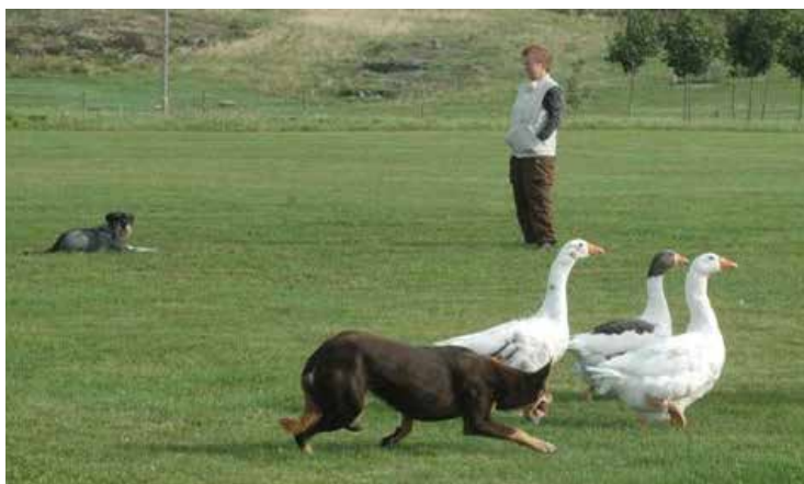
Schnauzergläntans Tula – tränar platsliggning med störning