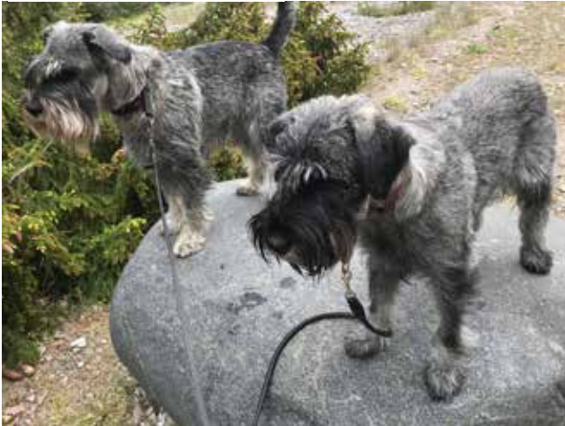
På spaning efter kaniner

Jag och husse har ett problem! Det handlar om kaniner. Vi har varit på något som husse kallar turné. Det betyder att man irrar runt hela tiden på en massa olika ställen. Då sover man i husbilen. Den kallas för Vickemobilen för det finns en stor bild av mig på baksidan. Den här gången var vi på Gotland, i Skåne och Danmark.