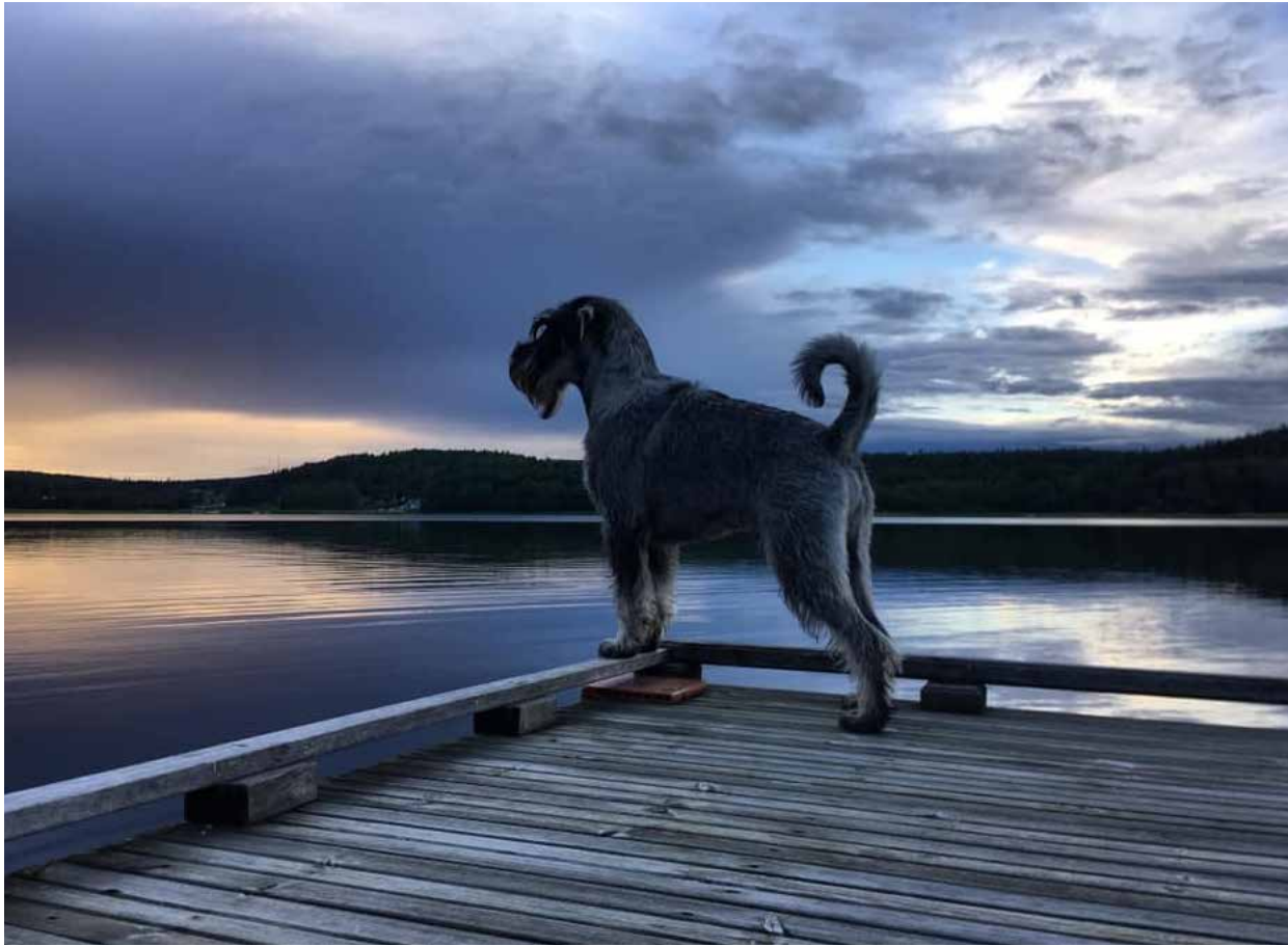
Argenta's Uno Unik