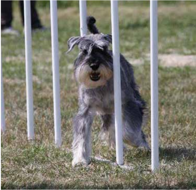
Wellfith's Feodora – rasens 2:a certifierade Räddningshund, rasens 3:dje Agilitychampion i Sverige.