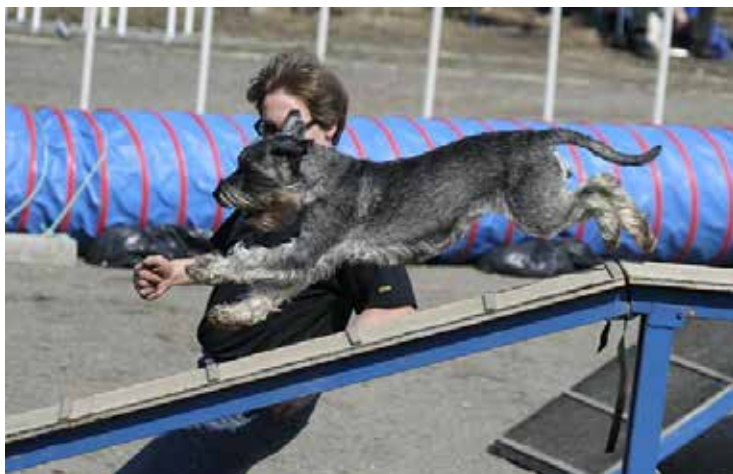
Pina i balansövning