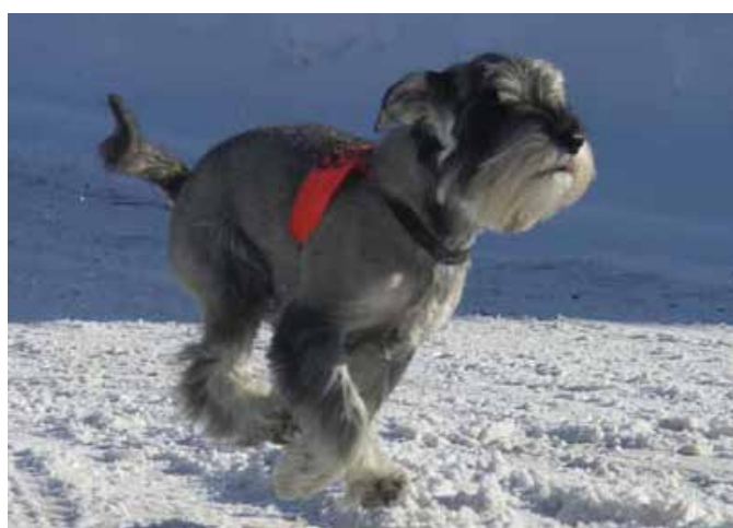
Ess i full fart med sök

Jag hyser stor beundran för alla tävlande schnauzrar och deras förare, som visar så fina resultat på klubbarna runt om i landet. Det är ingen tvekan om att schnauzern är den verkliga allround hunden, som kan prestera allt med en hängiven förare. Jag hoppas att komma dit. Efter att ha provat på nosarbete och rallylydnad förstår jag vilket arbete, som man måste lägga ner, men också vilken kapacitet vår ras har. Vi har misslyckats på två doftprov, men jag fick ny energi när Vicke klarade fyra olika sök efter ett långt uppehåll. Han kan, men resten hänger på husse.