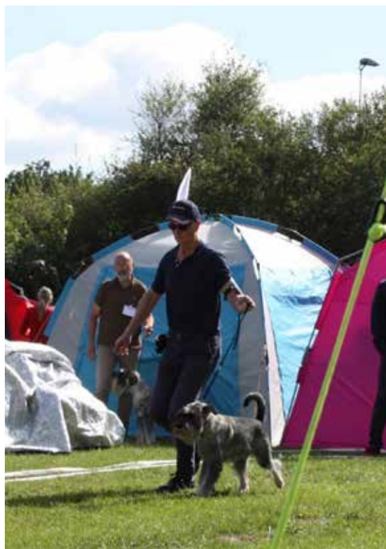
Husse och jag på ringspring

Ibland stannar man och kollar på olika ställen och det är då det händer. Kaniner!!!!!! Dom finns ju överallt. Dom bor i hål i marken och dom flesta är små och ulliga. Dom är jättemånga, särskilt på Gotland där vi var först. Ibland är kaninerna jättestora och har långa ben. Då kallas dom för harar.