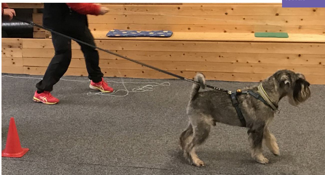
Argenta's Uno Unik sätter "spöket" på plats